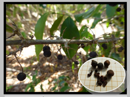
FRUITS À PLUSIEURS GRAINES