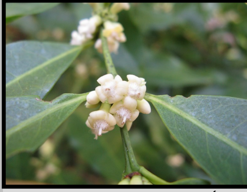
INFLORESCENCES SANS TIGES, DISPOSÉES DIRECTEMENT SUR LES RAMEAUX