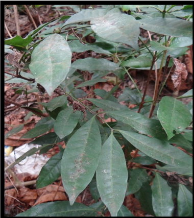
DESSUS DE FEUILLE VERT BRILLANT, NERVURES IMPRIMÉES

Feuilles opposées allongées, brillantes, sans poils