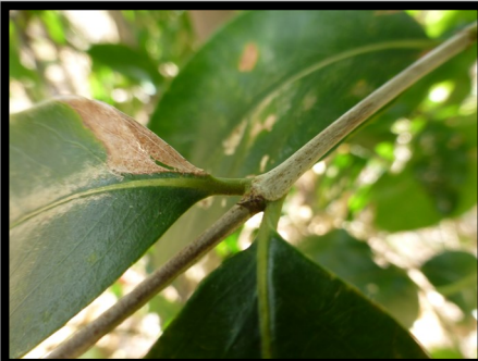
STIPULES EN POINTE