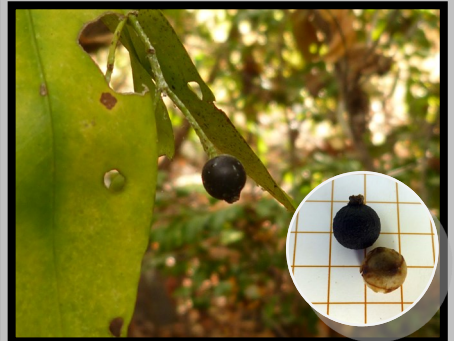
FRUIT A 1 GRAINE