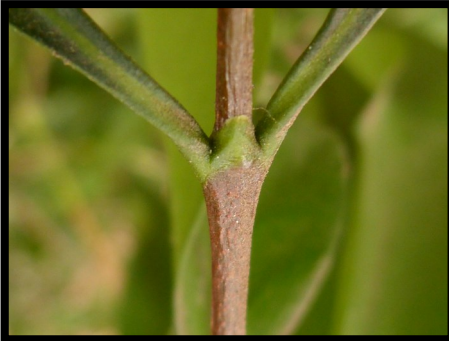
STIPULES ARRONDIES AU SOMMET