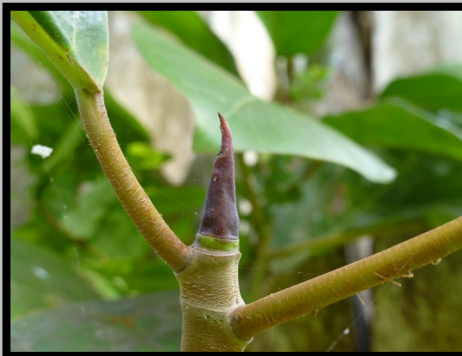
STIPULE TERMINALE FOLIAIRE