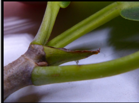
STIPULE TERMINALE FOLIAIRE