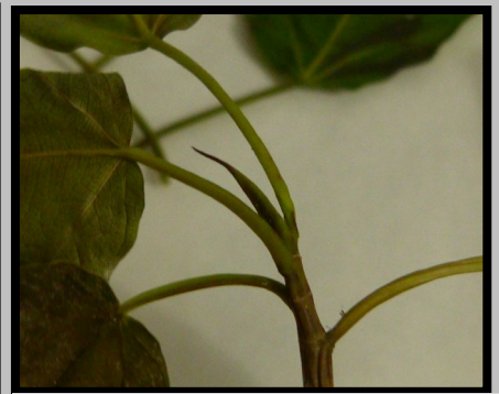
STIPULE TERMINALE LONGUE

Fruits : figes reliées à la tige par une petite queue (pédoncule), rouges à maturité