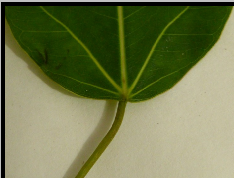
DESSUS DE FEUILLE 3 NERVURES À LA BASE

Feuille simples alternes nervures en relief