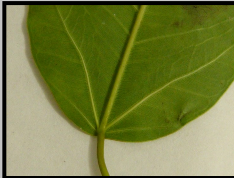
DESSOUS DE FEUILLE 3 NERVURES