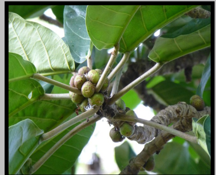
FRUITS ATTACHÉS AU RAMEAU