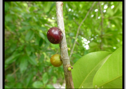
FRUITS ATTACHÉS AU RAMEAU