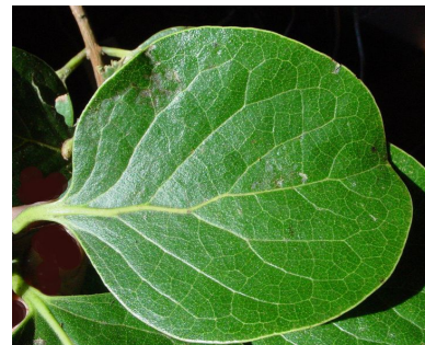
Feuille de mapou à grandes feuilles

Autres : sensible au vent ; croît dans des conditions de températures fraîches (espèce mésothermophile) ; post-pionnière à longue durée de vie.