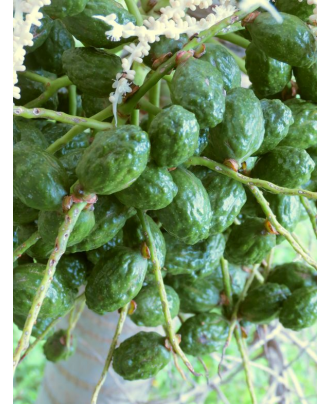
Fruits non matures

Autres : espèce susceptible d'être attaquée par certaines espèces d'insectes. Espèce dryade, structurante des forêts.