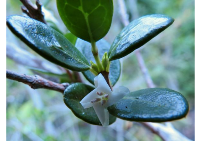
Rameau fleuri de bois de buis