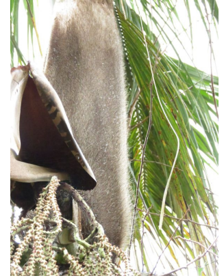
Détail : gaine foliaire couverte de po

Autres : espèce s'accommodant de conditions de température variables (eurytherme).