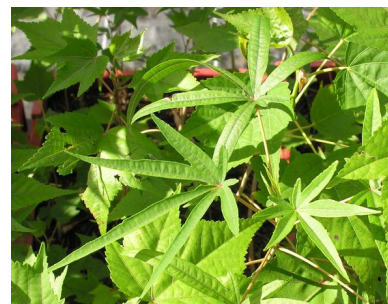
Détail: feuilles hétérophylles (var pal

Autres : résistante à la chaleur et aux variations de températures (sauf pour la variété palmata qui ne supporte pas le froid) ; peut résister au passage du feu.